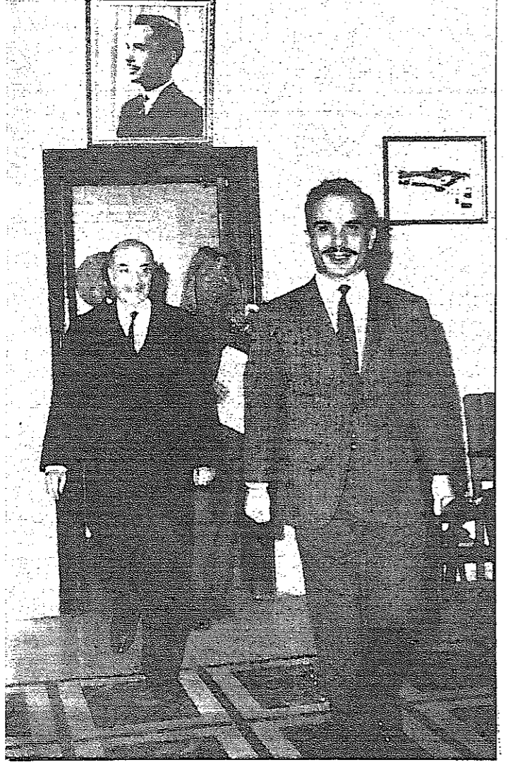
جلالة الملك العظيم لدى وصوله الى دار الرئاسة وخلف جلالة السيد بهجت التلهوني رئيس الوزراء واللواء الركن عامر خماش رئيس الاركان العامسة

الامم المتحدة - استأنف مجلس الامن الدولي اجتماعاته الساعة العاشرة والتصف من مساء أمس لمناقشة البحث في الشكوى الاردنية ضد الاعتداءات الاسرائيلية على القرى الاردنية .